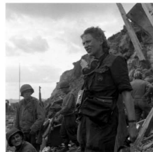
Lee Miller en Francia. 1944.