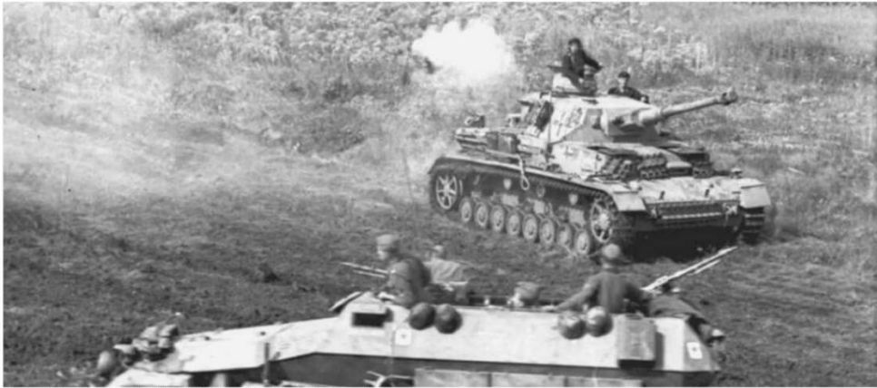
Panzer IV junto a un coche blindado Sd.Kfz. 251.

EN EL VERANO DE 1943, LA OFENSIVA NAZI CONTRA LA UNIÓN SOVIÉTICA, EN TORNO A LA CIUDAD DE KURSK, ACABÓ CONVIRTIÉNDOSE EN LA CONTIENDA CON MÁS CARROS DE COMBATE