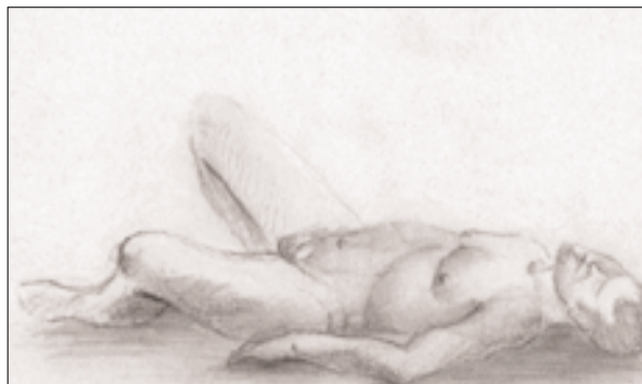
Fig. 2. “El descanso”. Dibujo de Tamara Alba González-Fanjul.

Este cambio de incidencia es debido a diversos factores como: el incremento de la esperanza de vida en ambos