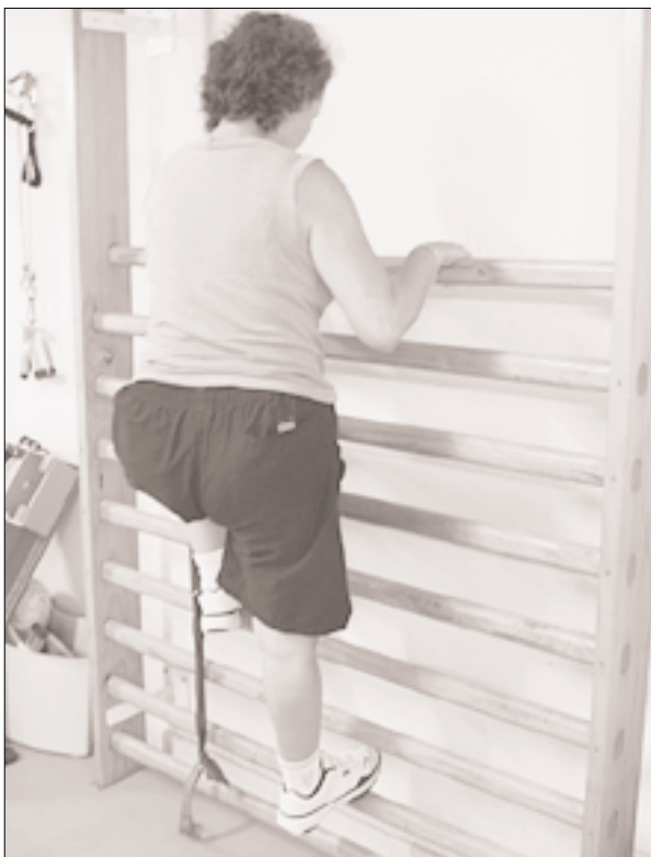
Fig. 6. Ejercicio de psicomotricidad en espalderas. Imagen tomada en el Centro de Fisioterapia de Alto Rendimiento "Marcial Pina".

equilibrio, el control emocional, la lateralidad, la orientación espacio-temporal, el esquema corporal, la organización rítmica, las praxias, la grafomotricidad, la relación con los objetos y la comunicación (a cualquier nivel: tónico, postural, gestual o verbal) (Fig. 6).