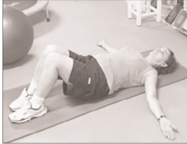
Fig. 5. Postura de Gerda Alexander acompañada de ejercicios respiratorios. Imagen tomada en el Centro de Fisioterapia de Alto Rendimiento "Marcial Pina".

Incluye no solamente la conciencia y el control de la postura, de la distribución del peso, la conciencia del to-