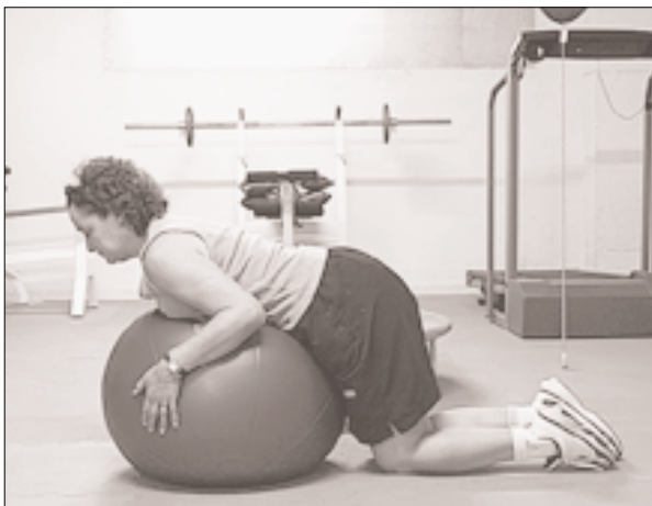
Fig. 3. Ejercicio de extensión lumbar con balón de bobath. Imagen tomada en el Centro de Fisioterapia de Alto Rendimiento "Marcial Pina".

Para ello se debe instruir al paciente en: eliminar actividades que impliquen cargar y levantar objetos; utilizar calzado apropiado con tacones de goma; emplear bastón para mejorar el balance y reducir las posibilidades de caídas; y aconsejar una correcta higiene postural.