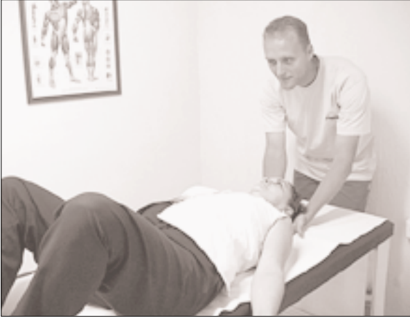
Fig. 4. Postura de R.P.G. en decúbito supino. Imagen tomada en el Centro de Fisioterapia de Alto Rendimiento "Marcial Pina".

en decúbito (Fig. 4) o en carga (sentado y de pie). Se eligen en función de la lesión, el morfotipo y el interés inmediato del paciente. El tratamiento se realiza en sesión individual de una hora de duración semanal.