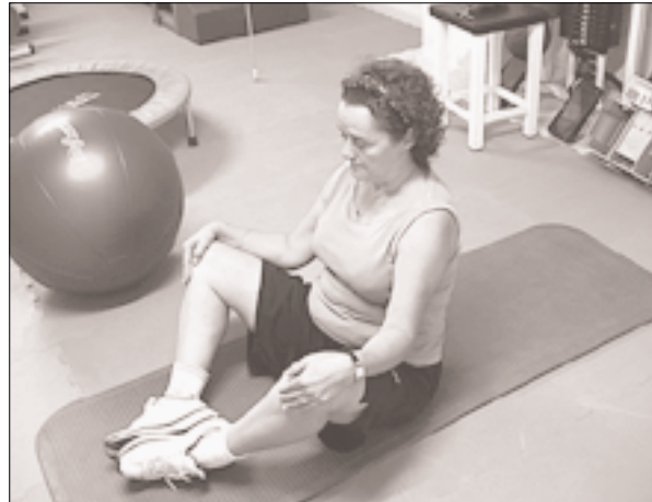
Fig. 8. Postura de control y relajación corporal en sedestación. Imagen tomada en el Centro de Fisioterapia de Alto Rendimiento "Marcial Pina".

Tras ese primer periodo de 30 días y cuando sea posible (teniendo en cuenta la personalización del tratamiento fisioterápico):