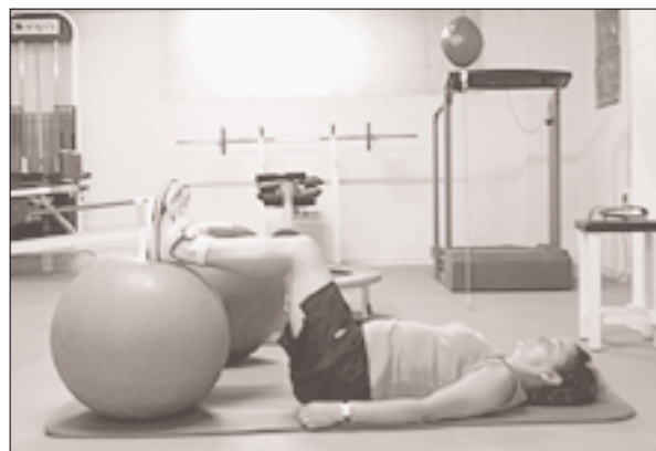
Fig. 7. Ejercicio de equilibrio en decúbito supino, con balón de Bobath, a 90° de flexión de rodilla y cadera, acompañado de un control de la respiración. Imagen tomada en el Centro de Fisioterapia de Alto Rendimiento "Marcial Pina".

Desde hace siglos la danza se ha convertido en el paso intermedio entre los hombres y el medio que los rodea, permitiendo al ser humano exteriorizar sus emociones. Permite una mejor y mayor capacidad de integración social, ya que potencia la cooperación con el resto del grupo de trabajo. Por otro lado, favorece el incremento de las aptitudes físicas y motoras.