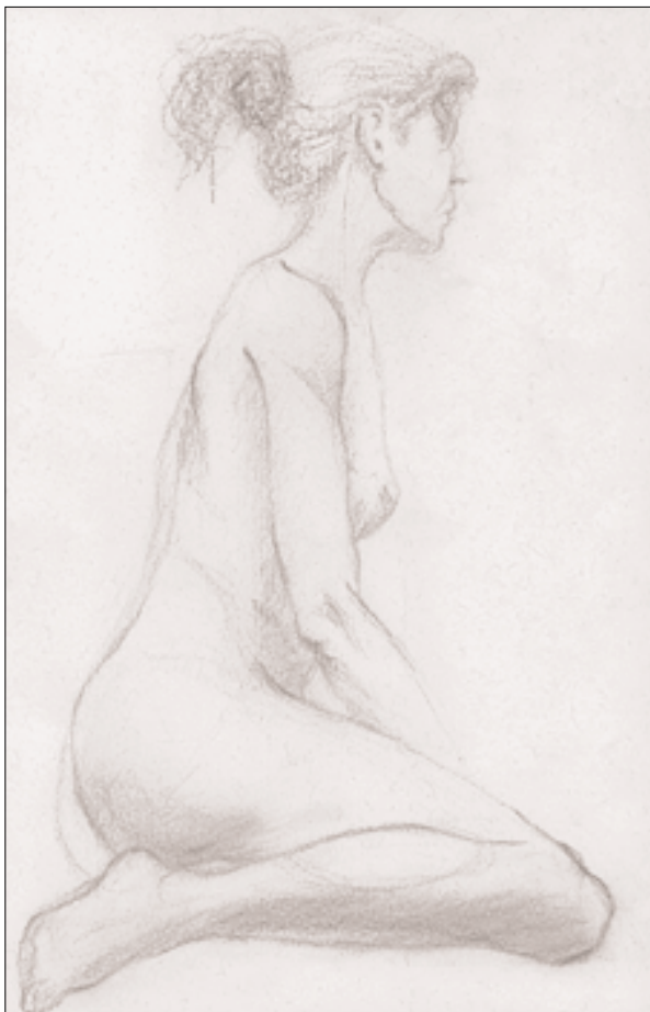
Fig. 9. "La paciencia". Dibujo de Tamara Alba González-Fanjul.

Pese a estar lejos de un definitivo remedio, no cabe la menor duda de que estamos avanzando mucho en el tratamiento de la osteoporosis, pero siendo realistas, la paciencia, la constancia en el trabajo y la voluntad del paciente son las mejores herramientas de las que dispone el fisioterapeuta junto con el resto del personal sanitario (Fig. 9).