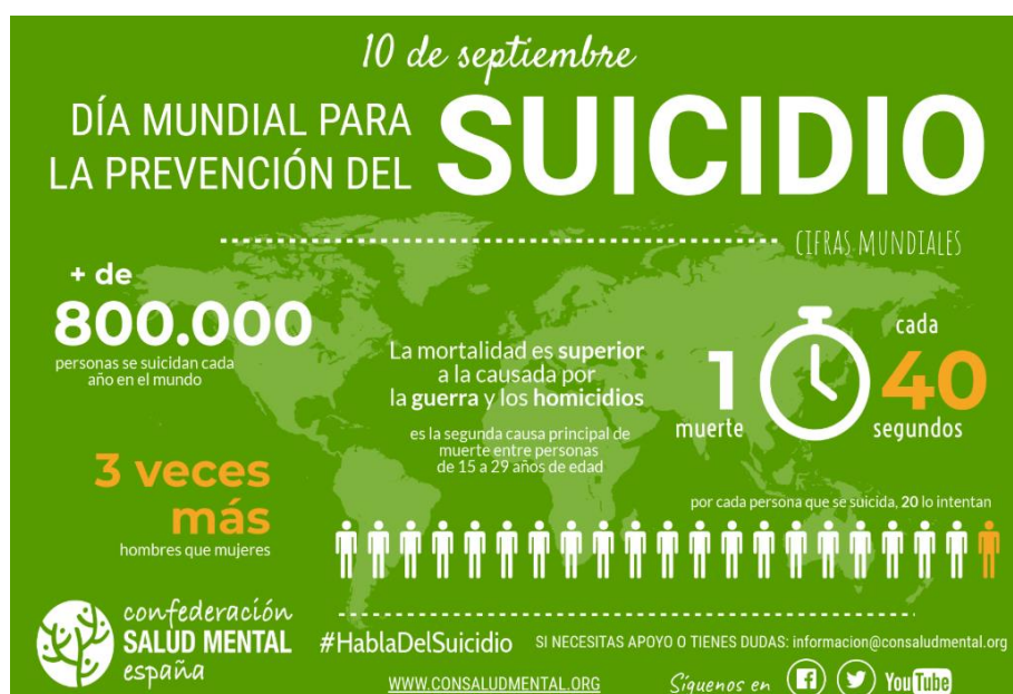
Figura 2: Campaña para el día mundial para la prevención del suicidio, 2018. Fuente: https://consaludmental.org/sala-prensa/dia-mundial-prevencion-suicidio-2018-40810/ Confederación Salud Mental España.

de 2018 puso en marcha la campaña “#HablaDelSuicidio” con motivo del Día Mundial para la prevención del suicidio: