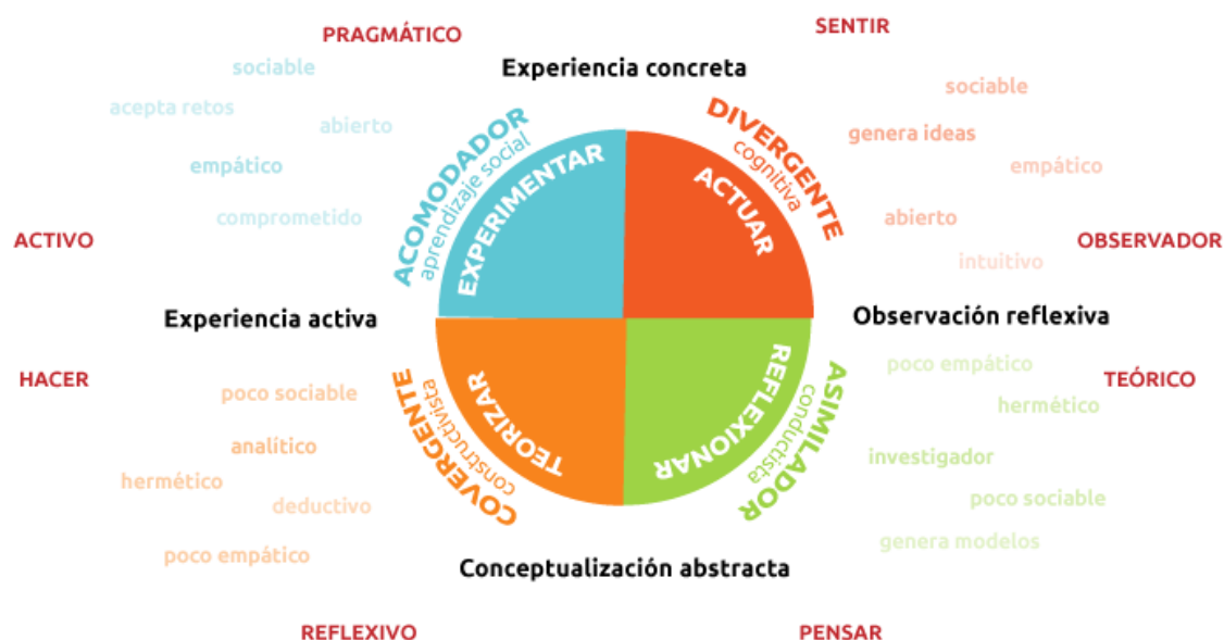
Figura II. Estilos de Aprendizaje de Kolb.

Aunque el Aps está basado en el aprendizaje experiencial, este puede presentar distintos matices dependiendo del enfoque que se le quiera dar. Un ejemplo de ello lo podemos encontrar en la clasificación que hace Morton (1995) (Citado en Chiva y Gil-Gómez 2018), según los objetivos que se pretendan alcanzar el Aps puede ser: