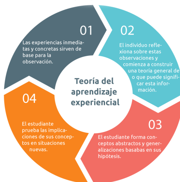
Figura I. Teoría del Aprendizaje Experiencial.

Después de planteada esta teoría del Aprendizaje Experiencial, Kolb plantea cuatro estilos de aprendizaje , basado en dos dimensiones principales: activo/reflexivo y abstracto/concreto. (Francisco et al. 2011).