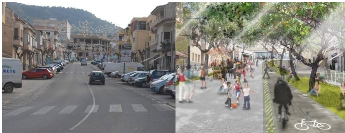
Figura 4. Estado actual y propuesto. “Actividad día sin coches”. Travesía Urbana de Pliego, Murcia

Además de la creación de estos espacios “específicamente” flexibles, toda la actuación tiene un carácter abierto, buscando una nueva mirada sobre la ciudad que nos permita conectar con el ciudadano. Para el nuevo trazado de la Travesía hasta su peatonalización definitiva se proponen una serie de actividades que faciliten esta transición. Gracias al nuevo diseño sin graves perjuicios para la movilidad del municipio. Entre ellas “el día sin coches” o el uso del vial para distintos mercados (figura 4).