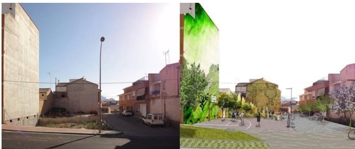
Figura 5. Estado actual y propuesta de recuperación de un solar. Travesía Urbana de Pliego, Murcia. Recuperación de Espacios R.

Dentro de estas herramientas de recuperación de espacios límite nos encontramos con las distintas variantes del Arte Urbano, que nos permiten releer el lugar. De este modo mejoramos la vida del barrio y la de las dotaciones que las complementan, recuperando entornos deteriorados sin un coste económico significativo, potenciando la vida económica y actuando como reclamo para visitantes (Figuras 5 y 6).