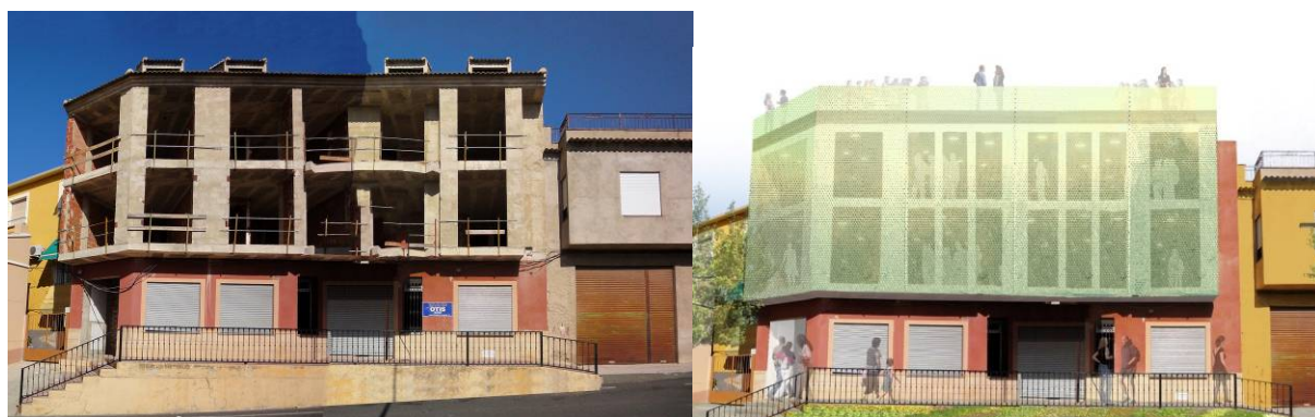
Figura 6. Estado actual y propuesta de recuperación de un edificio semiabandonado. Travesía Urbana de Pliego, Murcia. Recuperación de Espacios R.