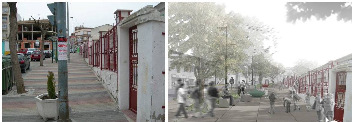
Figura 3. Estado actual y proyectado. Sección Viaria. Travesía Urbana de Pliego, Murcia.

Además de la creación de estos espacios “específicamente” flexibles, toda la actuación tiene un carácter abierto, buscando una nueva mirada sobre la ciudad que nos permita conectar con el ciudadano. Para el nuevo trazado de la Travesía hasta su peatonalización definitiva se proponen una serie de actividades que faciliten esta transición. Gracias al nuevo diseño sin graves perjuicios para la movilidad del municipio. Entre ellas “el día sin coches” o el uso del vial para distintos mercados (figura 4).